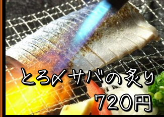
とろ×サバの炙り 720円