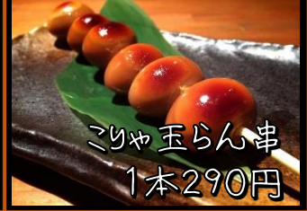
コリヤ 玉らん串 1本290円