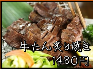
牛たん炙り焼き 1480円