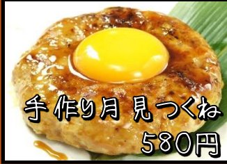
手作り月見つくね 580円