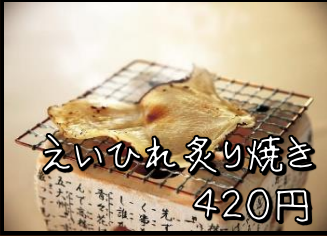
えいひれ炙り焼き 420円