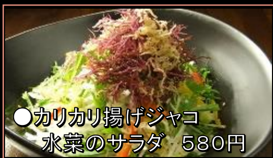
●カリカリ揚げジャコ 水菜のサラダ 580円