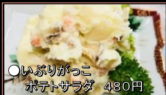
●いぶりがっこ ポテトサラダ 480円