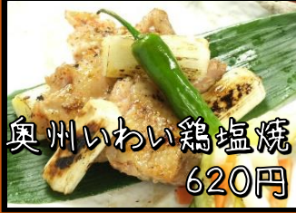
奥州いわい鶏塩焼 620円