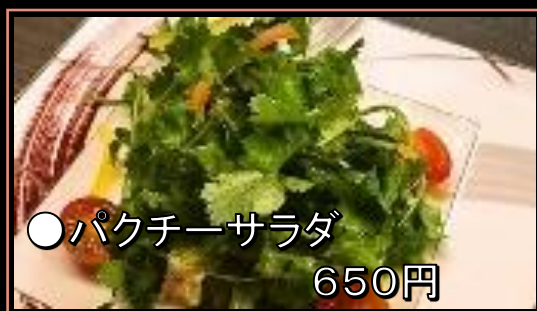
●パクチーサラダ 650円