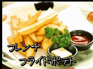
フレンチ フライドポテト