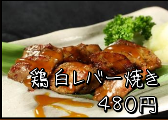
鶏白レバー焼き 480円