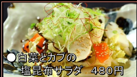
●白菜とカブの 塩昆布サラダ 480円