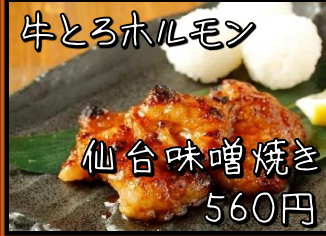
牛とろホルモン 仙台味噌焼き 560円