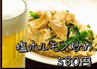
塩ホルモン炒め 580円