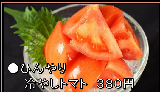
●ひんやり 冷やしトマト 380円