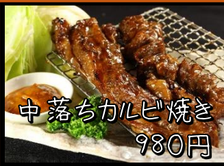
中落ちカルビ焼き 980円