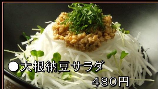
●大根納豆サラダ 480円