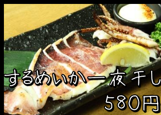
するめいか一夜干し 580円