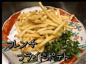
フレンチ フライドポテト