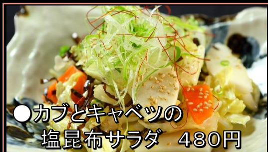
●カブとキャベツの 塩昆布サラダ 480円