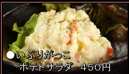
●いぶりがっこ ポテトサラダ 450円