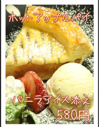
ホットアップルパイ