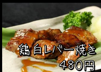
鶏白レバー焼き 480円