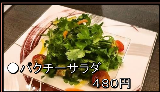
●パクチーサラダ 480円