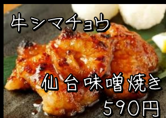
牛シマチョウ 仙台味噌焼き 590円