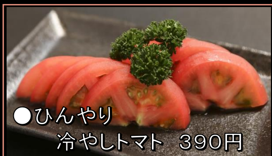
●ひんやり 冷やしトマト 390円