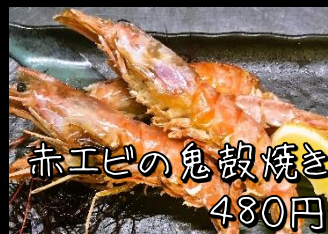
赤エビの鬼殻焼き 480円