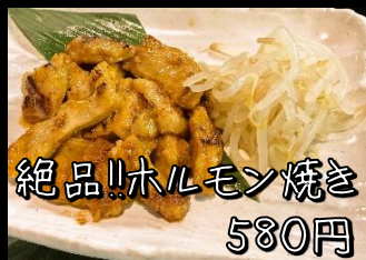
絶品!!ホルモン焼き 580円