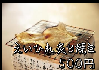
えいひれ炙り焼き 500円