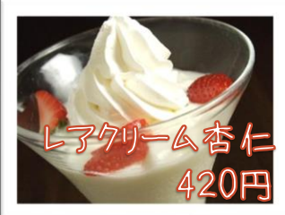
レアクリーム杏仁 420円