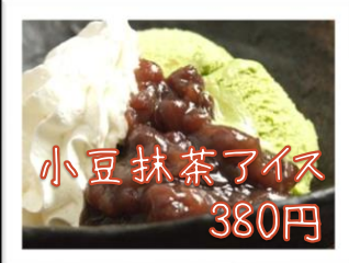
小豆抹茶アイス 380円