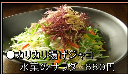
●カリカリ揚げジャコ 水菜のサラダ 680円