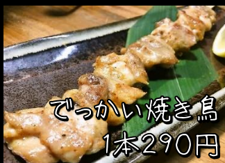
でっかい焼き鳥 1本290円