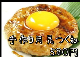
手作り月見つくね 580円