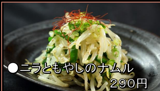
●ニラともやしのナムル 290円