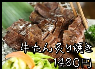
牛たん炙り焼き 1480円