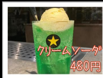
クリームソーダ 480円