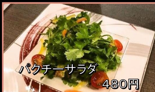
パクチーサラダ 480円