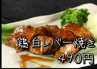
鶏白レバー焼き 490円