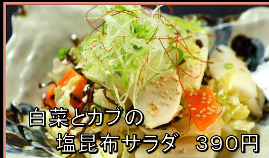
白菜とカブの 塩昆布サラダ 390円