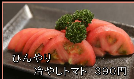
ひんやり 冷やしトマト 390円