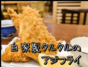
自家製タルタルの アジフライ