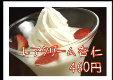
レアクリーム杏仁 460円