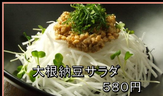
大根納豆サラダ 580円