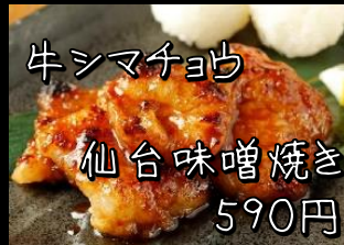
牛シマチョウ 仙台味噌焼き 590円