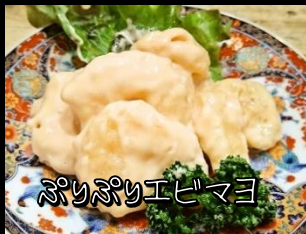
ぷりぷりエビマヨ