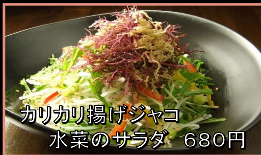
カリカリ揚げジャコ 水菜のサラダ 680円