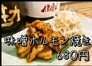
味噌ホルモン焼き 680円