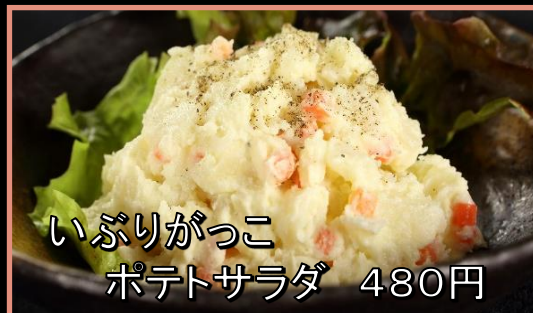
いぶりがっこ ポテトサラダ 480円