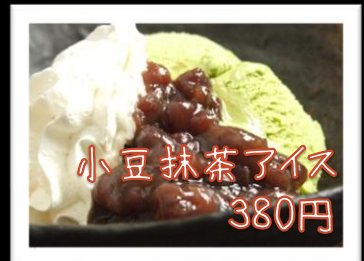
小豆抹茶アイス 380円