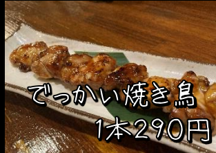
でっかい焼き鳥 1本290円